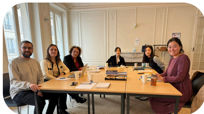
La visite de la délégation japonaise à l'UNAFORIS

Au final, ce moment a surtout permis de créer du lien, de mieux comprendre les réalités de chacun, et de repartir avec des pistes de réflexion, des deux côtés.