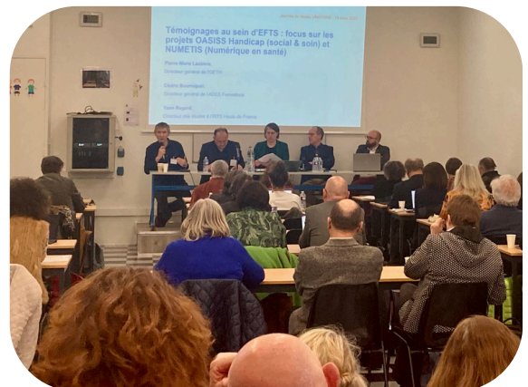
Journée du réseau UNAFORIS, le 19 mars