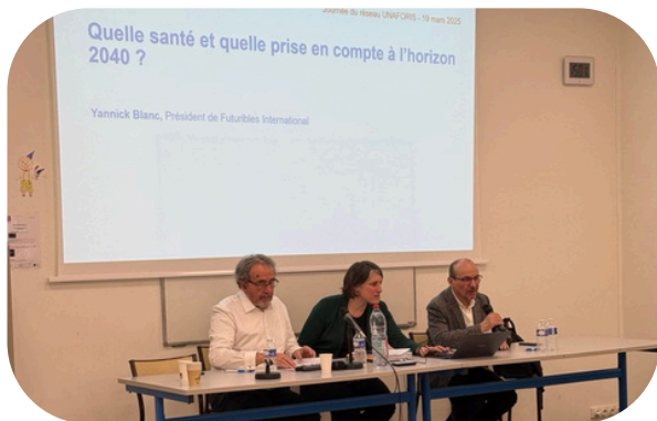
Journée du réseau UNAFORIS, le 19 mars

La journée a alterné échanges et présentations de projets concrets, comme NUMETIS, pour intégrer le numérique dans la santé, et OASISS, pour faciliter l'insertion professionnelle des personnes en situation de handicap dans les métiers du social et du soin. Ces initiatives montrent comment l'innovation peut répondre aux défis du secteur. La réflexion s'est achevée par une projection sur l'avenir, soulignant la nécessité d'adapter les formations et métiers aux transformations sociétales, économiques et technologiques, tout en renforçant le lien humain et la coopération entre acteurs.