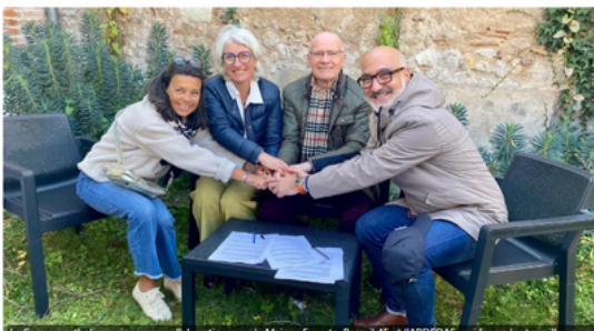
Le Secours catholique signe une collaboration avec la Maison Euverte, Bercail 45 et l'ARDROAV, qui forme les travailleurs...

À Orléans, trois associations rejoignent le Secours catholique pour renforcer la Maison des familles