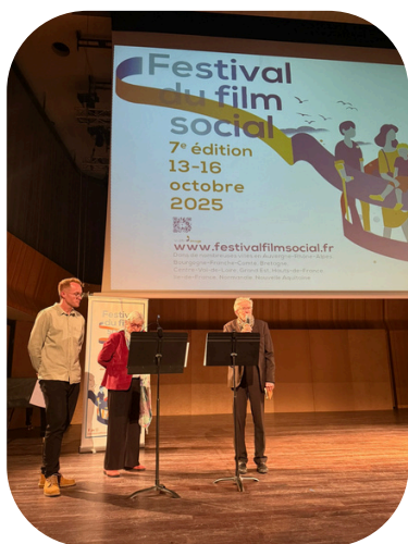
Cérémonie de clôture du Festival du film social

Le film suit la ferme de Ker Madeleine, entre Nantes et Vannes, qui accueille des détenus dans le cadre d'un « placement extérieur ». Avec sensibilité et humanité, la réalisatrice interroge la capacité du travail, du collectif et du lien à redonner du sens à la liberté, offrant un regard profond sur la réinsertion et la construction du lien social.