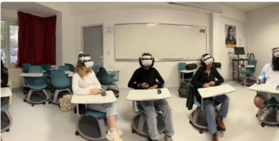
Depuis d'octobre 2023 à septembre 2025, le projet rassemble quatre partenaires : EFD, CEFAL, Stéphanie Lécuyer et ITC (Espagne).

Accueil • Pyrénées-Atlantiques • Ustaritz