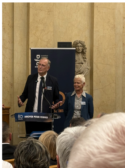
Les 80 ans de la Fondation INFA