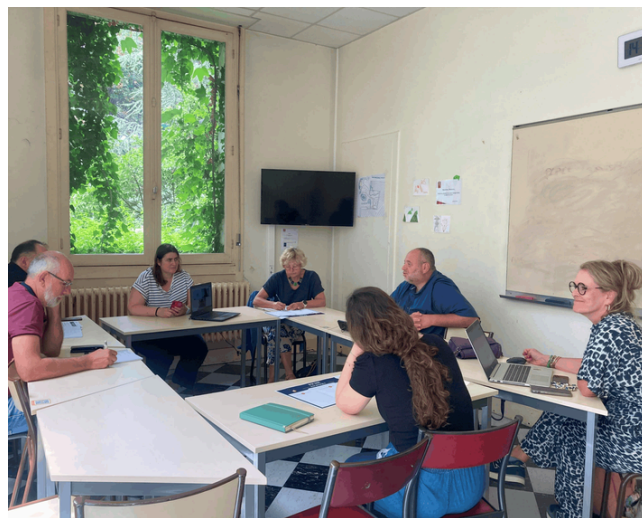
Le comité des plateformes OASISS