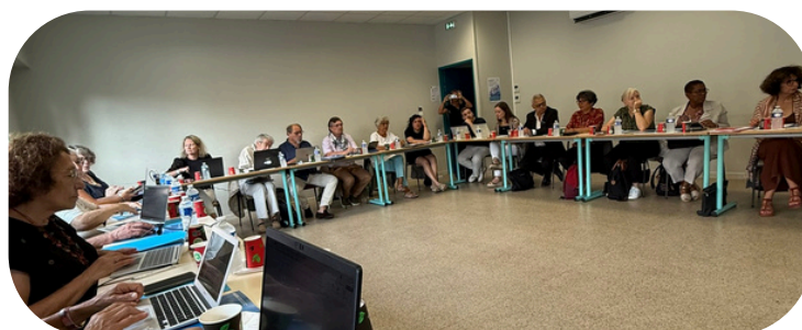
Séminaire du Conseil d'administration de l'UNAFORIS