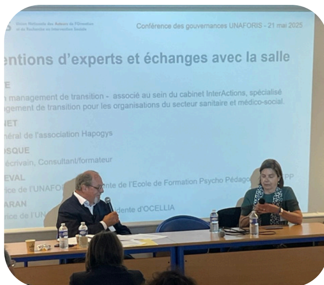
Conférence des gouvernances de l'UNAFORIS