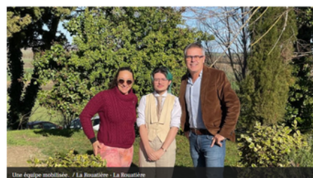
Une équipe mobilisée - La Rouatière - La Rouatière

Erasmus Eragrisoc : Le lycée La Rouatière s'engage dans l'accompagnement de ses apprenants grâce à une équipe mobilisée