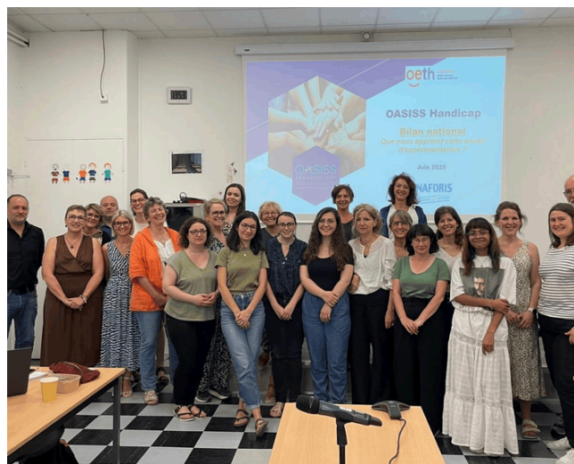
Le comité des plateformes OASISS