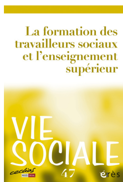
La revue Vie Sociale

L'UNAFORIS poursuit cet engagement en restant contributrice active de la revue et en soutenant sa diffusion au sein du réseau.