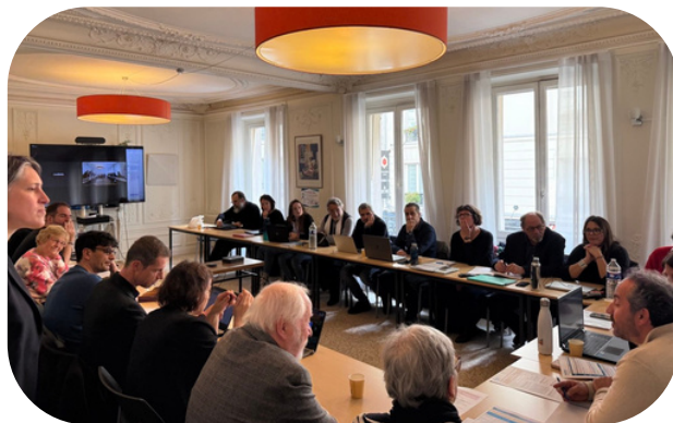
Le deuxième séminaire de recherche sur les approches cliniques

Ces rencontres confirment le rôle de l'UNAFORIS comme lieu de dialogue et d'innovation pour la recherche en travail social, offrant aux équipes pédagogiques et aux chercheurs des outils et clés d'analyse, pour mieux comprendre le secteur et renforcer leurs pratiques. En 2026, ce cycle sera poursuivi avec de nouveaux séminaires, afin de continuer à explorer des méthodologies complémentaires et à développer une dynamique collective de recherche au service du réseau.