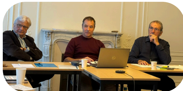
Le troisième séminaire de recherche sur les approches juridiques