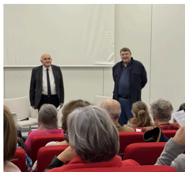
Les 125 ans de la Fondation ITSRS

Cette liste ne prétend pas être exhaustive, mais elle donne à voir une réalité : celle d'un réseau en mouvement, entre héritage et développement.